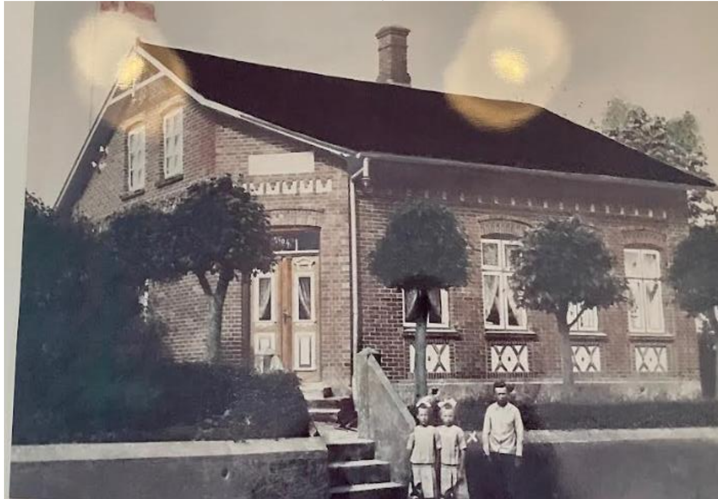
Tovskovvej 47 i Mølby, huset er bygget år 1900. Foto fra ca. 1914. På billedet ses beboere fra Fabrin familien.