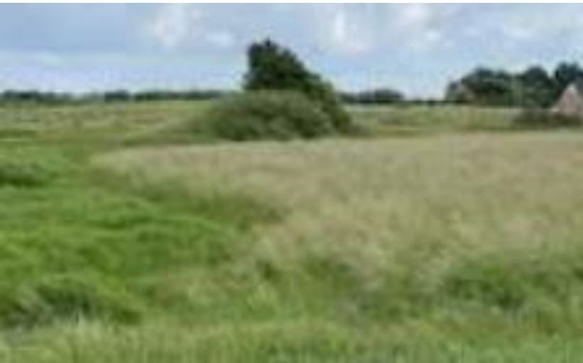
Synlige rester uden for Mølby: Slotsbjerget ved Lertevej